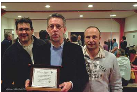
Il sindaco tra due volontari di P.C.

Questi volontari costituiscono un gruppo affiatato e motivato, costruito attorno al nucleo originario della squadra antincendio boschivo, costantemente addestrati che tutti ci invidiano e prendono a modello. Non bisogna poi dimenticare che assieme ai volontari