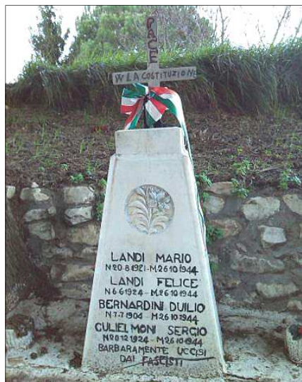
Il monumento ai caduti di via Crociata