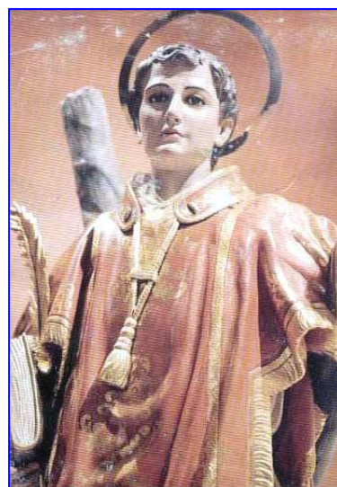
San Vincenzo martire nostro titolare